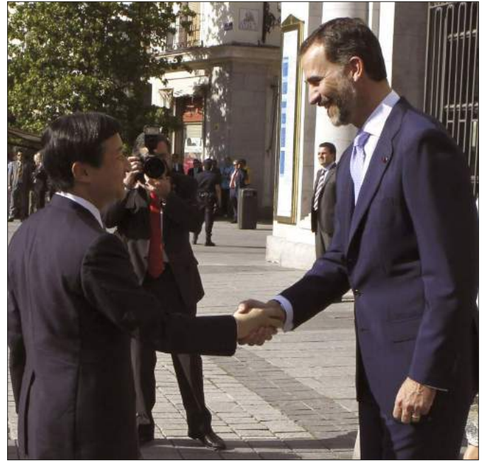
El príncipe heredero de Japón saluda a S.A.R. el príncipe de Asturias a su llegada al Teatro Real de Madrid durante su visita oficial a España en junio de 2013 © FOTO MAEC.

Se restablecieron plenamente en 1952, tras la ruptura a finales de la II Guerra Mundial, y son buenas en todos los ámbitos. España es uno de los países occidentales con relaciones más antiguas con Japón, con quien entró en contacto por primera vez en el s. XVI. En 2014 se conmemoró el IV Centenario de la llegada a España de la primera misión oficial de Japón a un país europeo. Con tal motivo, durante 2013 y 2014 tuvo lugar en ambos países el “Año dual” de España en Japón y de Japón en España.