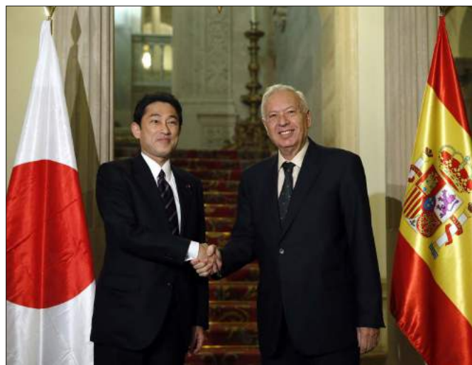
El ministro de Asuntos Exteriores de Japón, Fumio Kishida, saluda a José Manuel García-Margallo durante su visita a Madrid en enero de 2014.